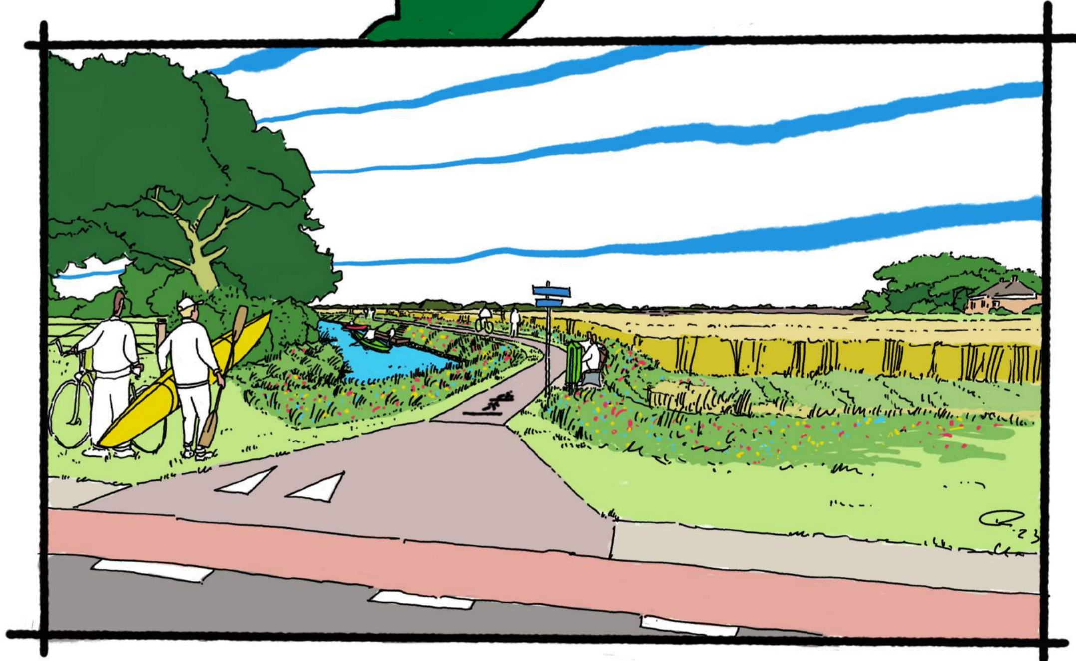
Locatie II - aansluiting fiets- voetpad bij Lageweg